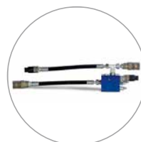
Optionele verdeler voor gebruik met hydraulische aggregaten

De HRH500*** is een unieke, hydraulische handzaagmachine voor wand- en vloersneden tot 400 mm. De ringzaag voorkomt oversnijden en biedt daardoor een alternatief voor hoekboringen en diamantkettingzagen. Het gepatenteerde, zelfzekeren-